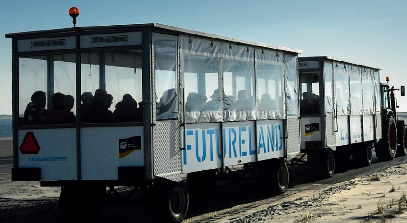
De FutureLand Express rijdt met toeristen langs de miljoen helmgrasplantjes die handmatig in de Tweede Maasvlakte zijn geplant.